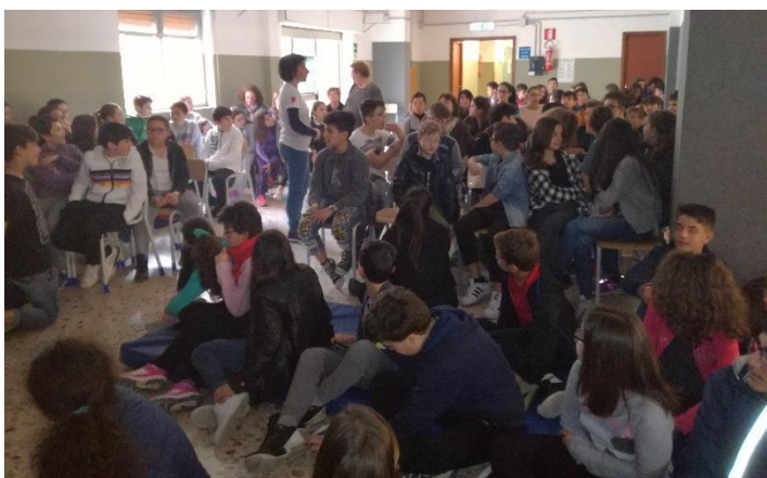
Incontro al plesso "Carducci" 29 Marzo